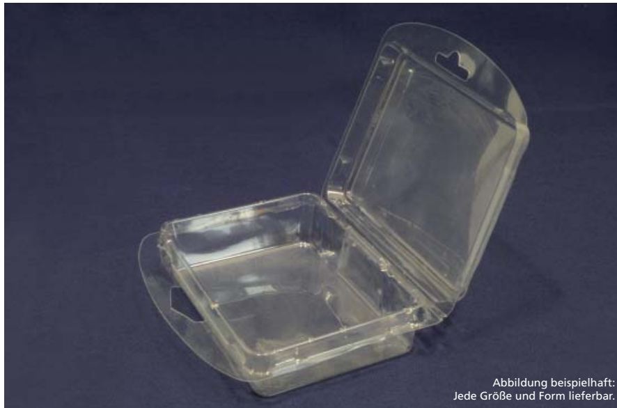
Abbildung beispielhaft: Jede Größe und Form lieferbar.